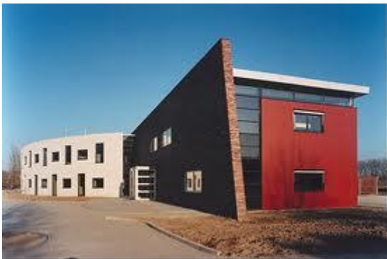
Oosterlicht College vestiging Vianen