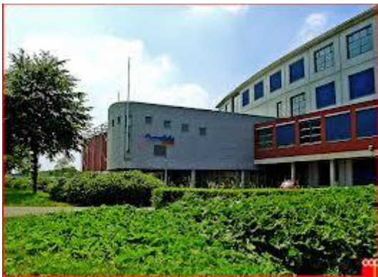
Oosterlicht College vestiging Nieuwegein