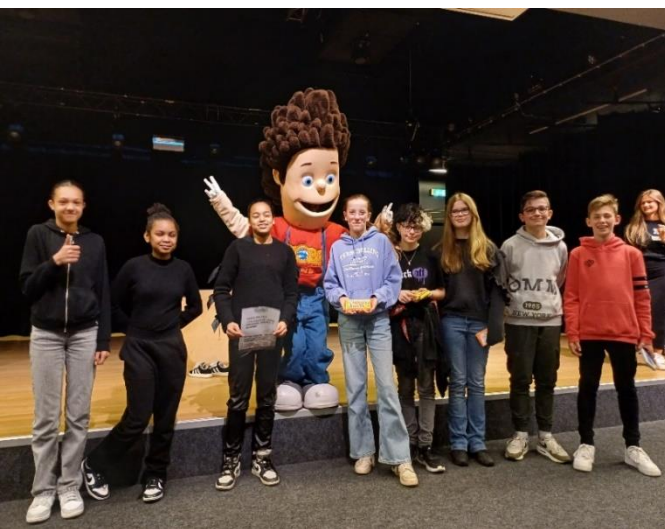
Globaland 2024: links de winnaars en rechts de tweede plaats

Op 2 en 3 april namen alle eerstejaars leerlingen deel aan het jaarlijkse project Globaland.